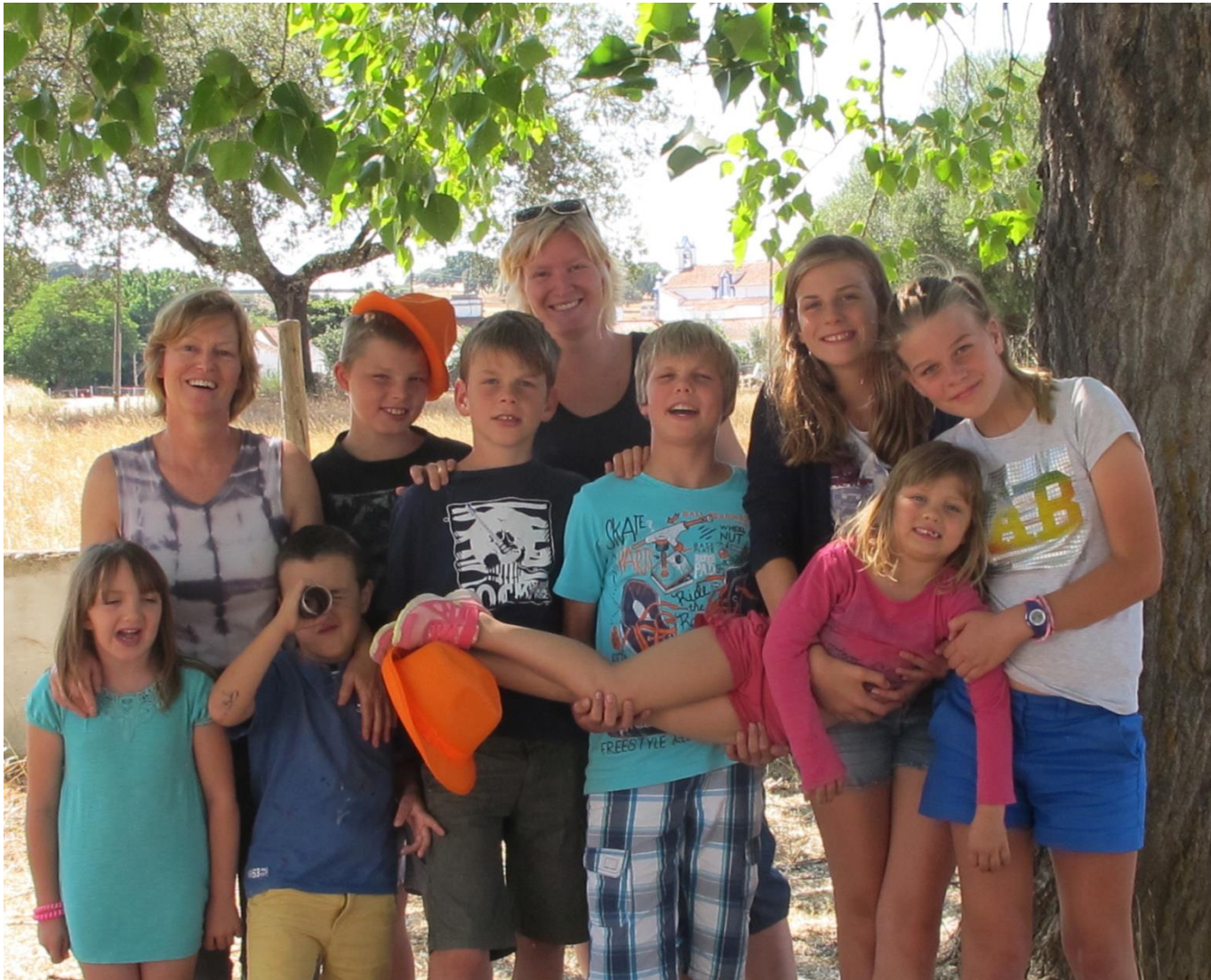
Klassenfoto Santa Sofia schooljaar 2014-2015!